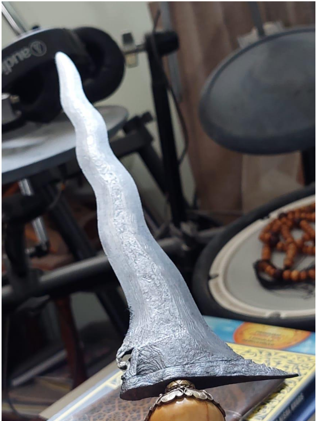
Keris Raja Permaisuri @ Raja Hamidah, permaisuri kepada Sultan Mahmud Shah III